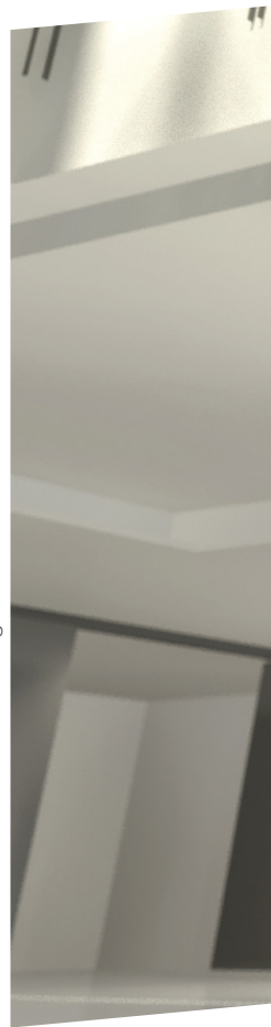
ZonarSound CZ 04/2014 | twindesign.cz